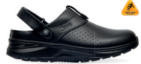
IQ SR W & M BLACK