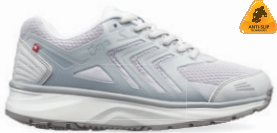
ELECTRA SR WHITE/GREY