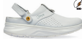
IQ ESD W & M WHITE