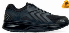
ELECTRA SR BLACK