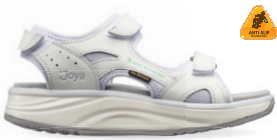
KOMODO SR WHITE