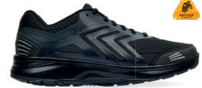
FLASH SR BLACK