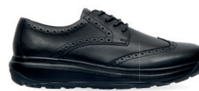
PASO FINO II BLACK